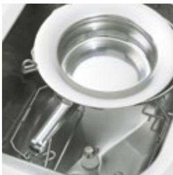
Holder til bekken og håndtak. Delennr. 499 95 72-00.