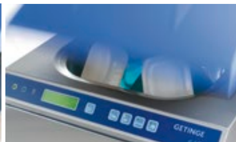
Lokket åpnes helt når pedalen trykkes.