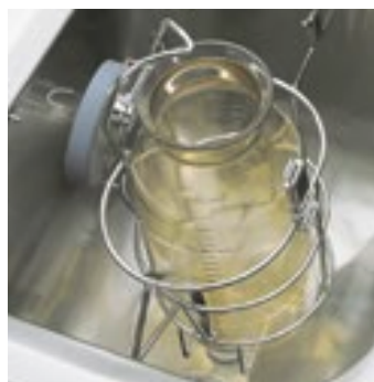
Holder til sugeflaske 2-5 liter. Delennr. 500 44 00-00.