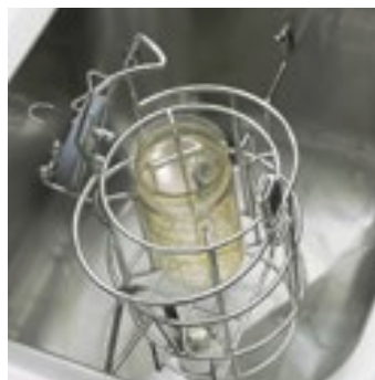
Ekstra holder til sugeflaske 0,7 liter. Delennr. 500 07 72-00. Passer holder Delennr. 500 44 00-00.