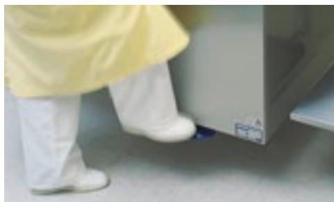
Fotpedalen er standardutstyr.