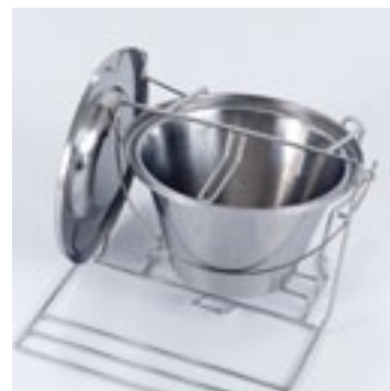
Bøtte med lokk