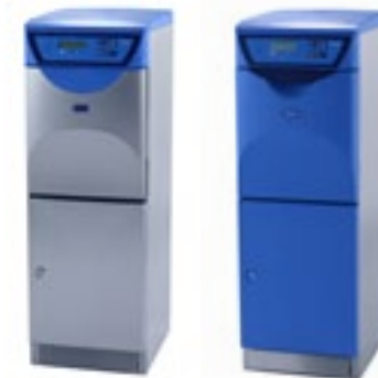
Getinge FD1800, frittstående modeller i rustfritt stål eller polymer