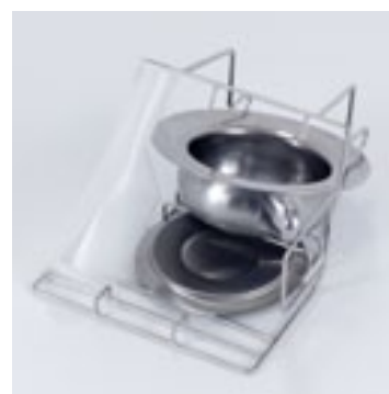
Urinflaske og bekken med lokk

Getinge tar hensyn til alle aspekter ved vaskerommet, og leverer omfattende støtte fra opplæring i gode hygienerutiner til råd om romlayout og valg av utstyr. Getinge tilbyr også et komplett møbelkonsept for vaskerommet, som bidrar til å skape et hygienisk og sikkert arbeidsmiljø for kunden.